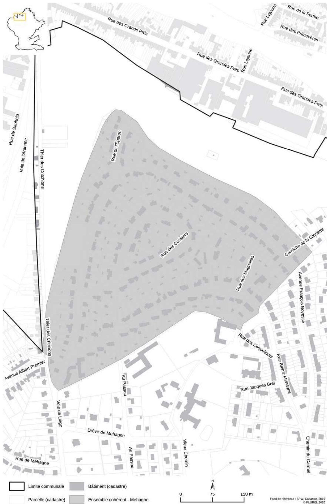
Ensemble cohérent – Mehagne