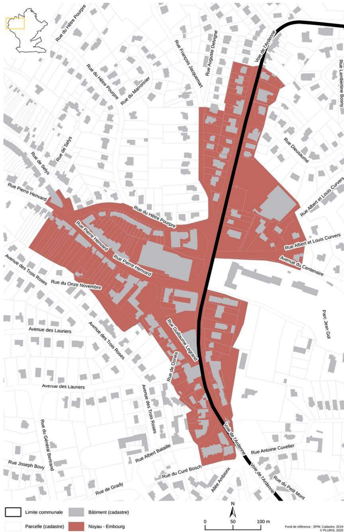
Noyau - Embourg